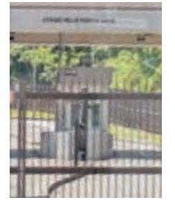
将校用家族住宅前ゲート