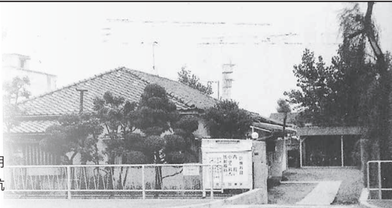
▲最初の良元診療所

戦闘機をつくる川西航空機という大工場があり、最盛時は4万人の従業員が乗降するため軍の命令により