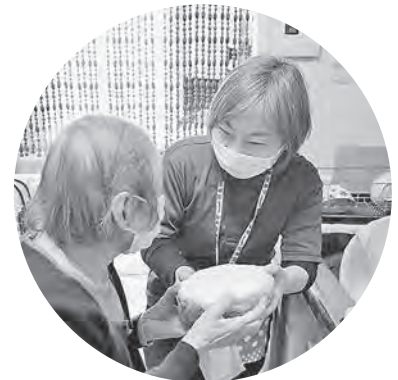
▲今日の夕飯何にしましょうか？ 共に考え調理します

介護保険が利用できるように、専門職としての誇りを持ち働き続けられるように、共に学び共に育ち合う仲間たちと運動できる事業所を目指していきます。少しずつですが私たちの運動がつながり、広がり、大きな声となり、国へ届き変わることを信じて取り組みを大切にしたいと考えています。