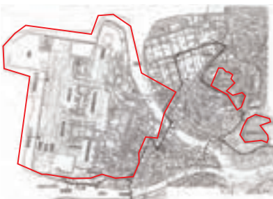
全体地図(赤囲みが米軍所有)

なっています。また、「沖合移設」の名目で基地を刷新し、新たに港湾を設けたことで空母艦が寄港しやすくなっています。また、「沖合移設」の名目で基地を刷新し、新たに港湾を設けたことで空母艦が寄港しやすくなっています。また、基地近くには兵隊相手の将校用家族住宅が設けられており、それらを日本の予算で賄っているとのこと。また、基地近くには兵隊相手の将校用家族住宅が設けられており、それらを日本の予算で賄っているとのこと。また、基地近くには兵隊相手の将校用家族住宅が設けられており、それらを日本の予算で賄っているとのこと。